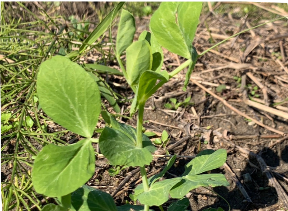
↑えんどうがすくすくと育っています^^

10月にゆめプロの畑が2つ増えました！ これまで柏原のジャングルのような畑で野菜を育てていましたが、イノシシが食べてしまうこともしばしば…。 ゆめプロ活動拡大のためにも住宅街の一角にある新しい畑を借りて、生産性を上げていきます！